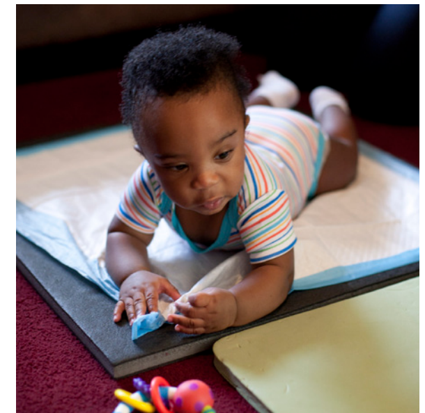
El momento de jugar con su bebé boca abajo requiere práctica