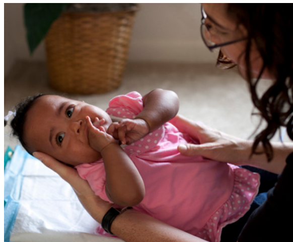
Cuando no esté listo para jugar: El bebé está demasiado estimulado y mira hacia otro lado