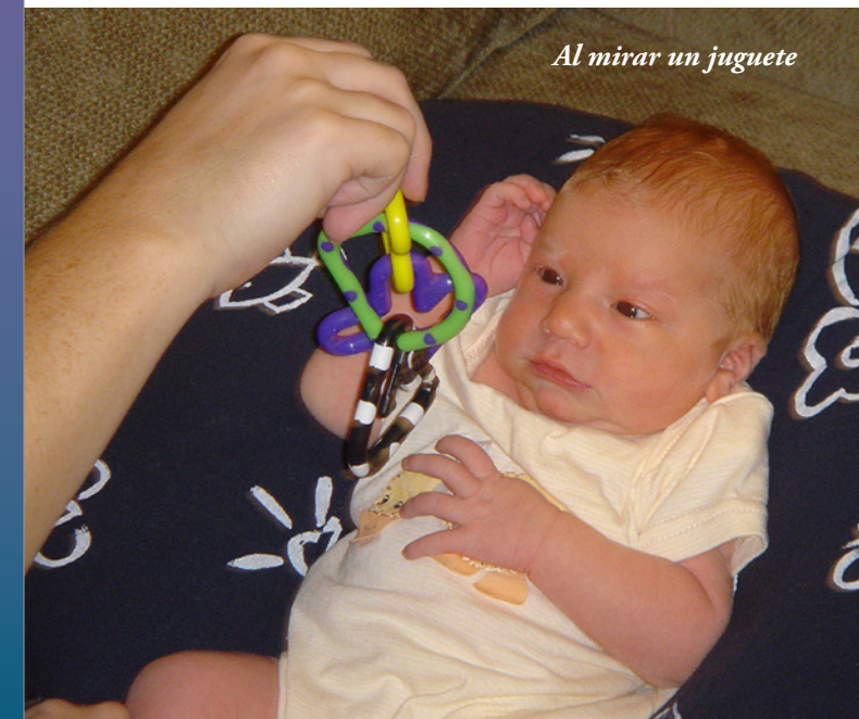
Al mirar un juguete

Esta es la edad ajustada de su bebé en este momento.