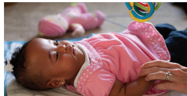
Read Listo para jugar: El bebé está relajado y mirando un juguete